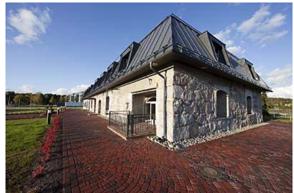
Vuokra-asuntoon kuuluu aurinkoinen terassi.