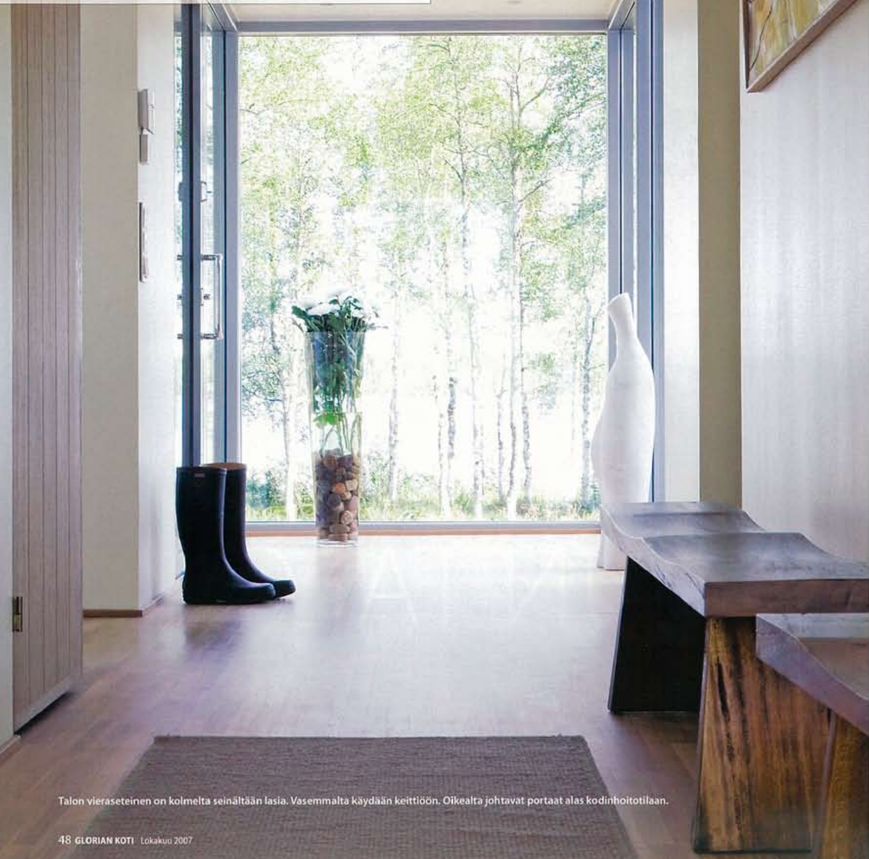
Talon vieraseteinen on kolmelta seinältään lasia. Vasemmalta käydään keittiöön. Oikealta johtavat portaat alas kodinhoitotilaan.

Lasikäytävä yhdistää kelomökin ja uuden talon. Korkeaan ateljeehen nouseaan puoli kerrosta ja siitä taas puoli kerrosta keittiön päälle isoon makuuhuoneeseen. Lasinen vieraseteinen on uuden talon pohjoissivulla.