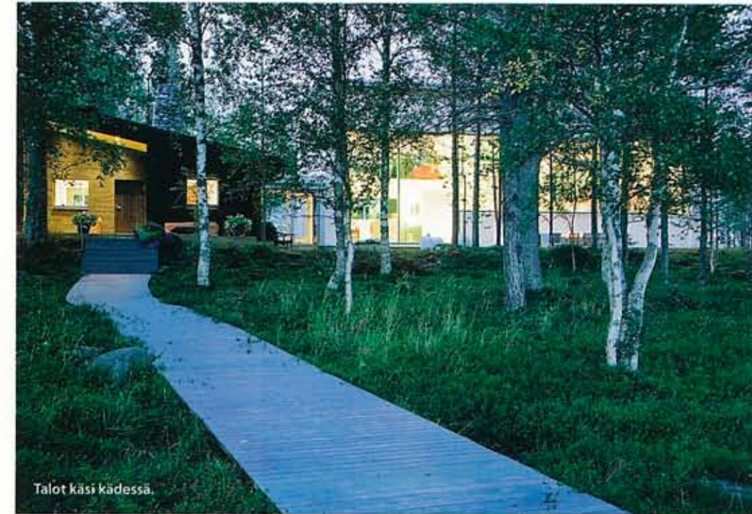
Talot käsi kädessä.

Uusi talo on minimalistisen eleeen, jotta se ei kilpailisi Lapin luonnon kanssa.